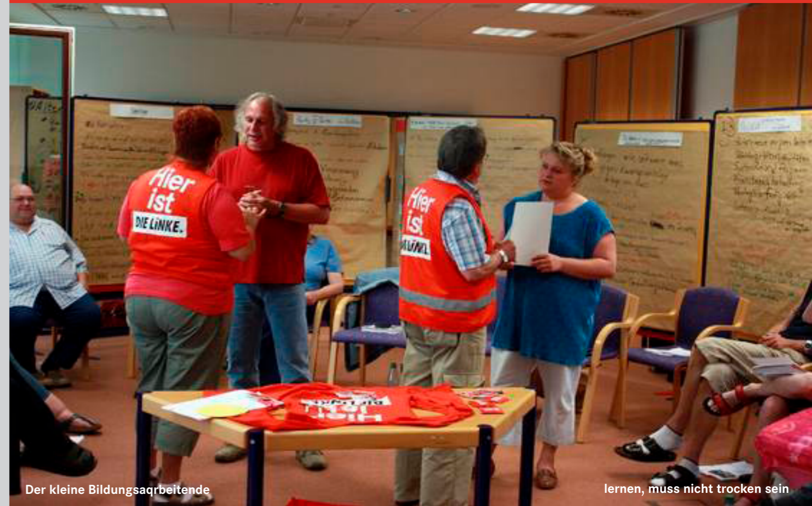
Der kleine Bildungsarbeitende