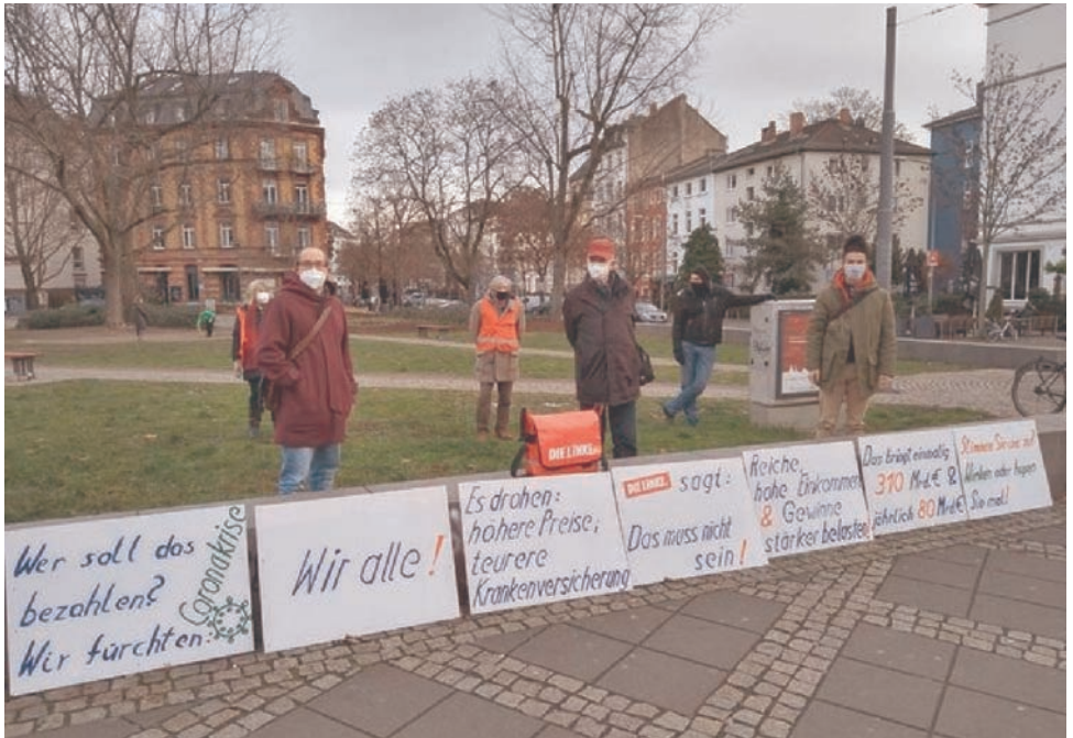
Schilder hochhalten an einer vielbefahrenen Straße: Das geht immer!