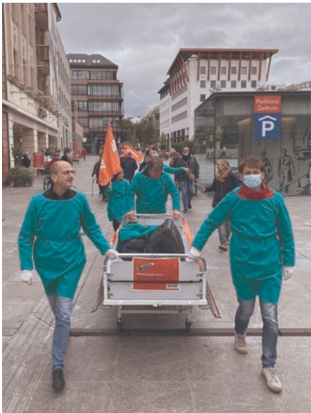
Gesundheit ist keine Ware! Die Aktion mit Krankenhausbett fand in vielen hessischen Kreisverbänden statt. Das geht auch mit Maske und Abstand.

Liebe Genoss:innen! Auch während der Pandemie kann öffentlichkeitswirksamer Wahlkampf stattfinden. Natürlich gelten die nötigen Hygiene- regeln.