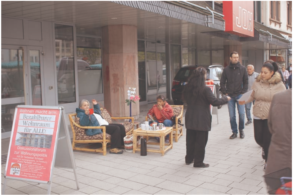
Aktionen zum Thema: „Wohnen muss bezahlbar sein!“