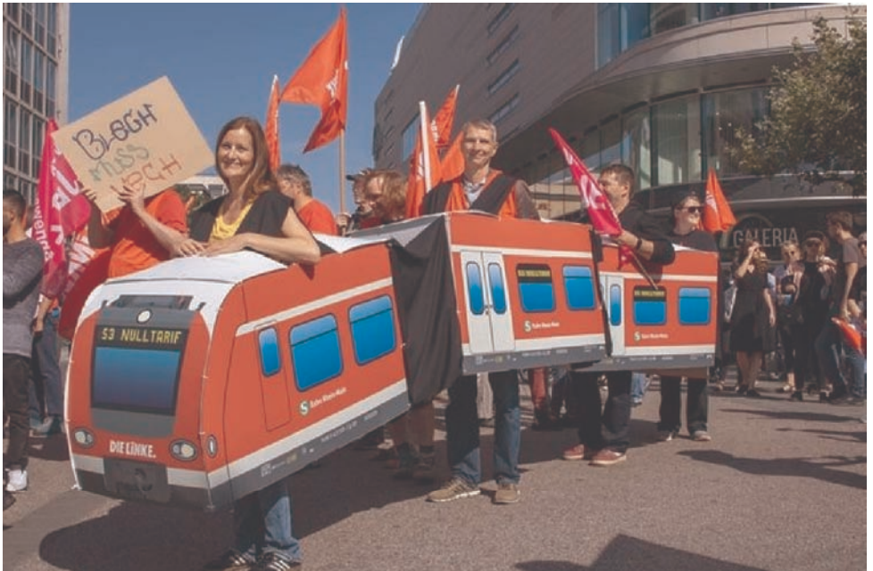
Das ist schon etwas aufwendiger: Straßenbahn aus Pappe. Es geht aber auch ein „Lindwurm“ aus alten Bettüchern.