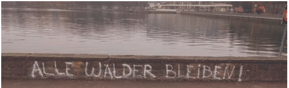
Manchmal genügt ein Stück Kreide!

Wir wünschen viel Spaß und würden uns freuen, wenn ihr uns Fotos eurer Aktionen zusendet. info@polbildung-die-linke-hessen.de