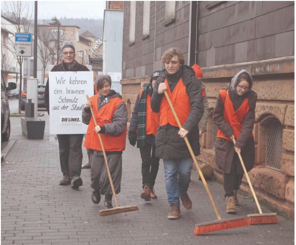
Aktion gegen Rechts: Wir kehren den braunen Schmutz aus der Stadt. Eine öffentlichkeitswirksame Aktion ohne direkte Konfrontation mit einer Polizeiarmada, die das Tagungsgelände der Faschos abriegelt hatte.