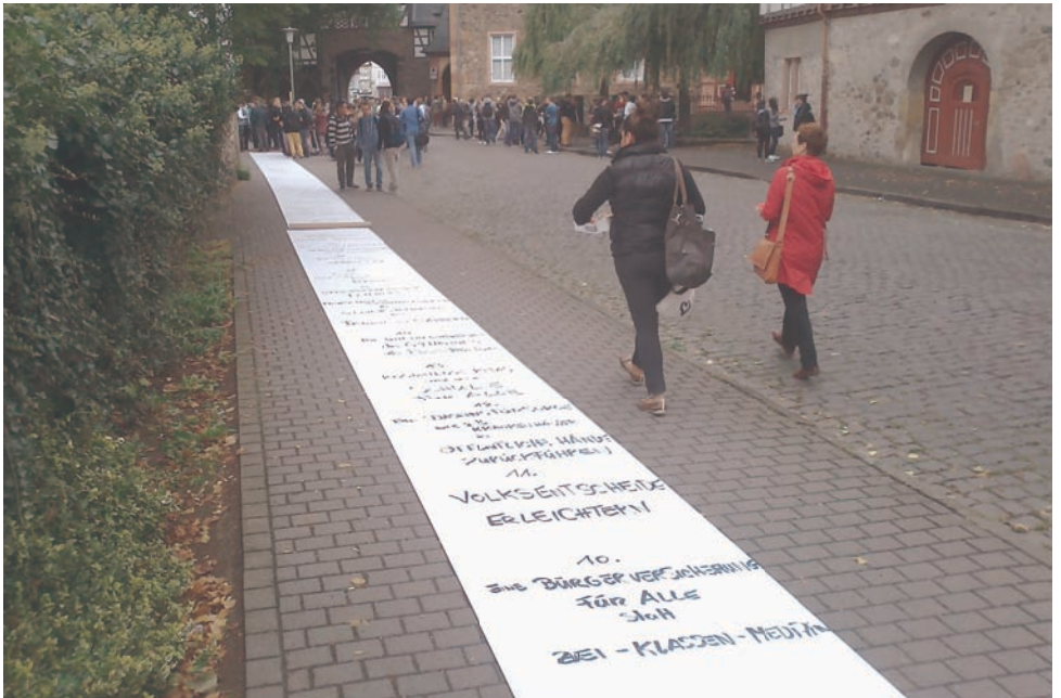
Plakatrolle mit den Hauptforderungen aus dem Wahlprogramm. Oder kurz und knapp, was wichtig ist. Alte Tapeteneollen hat jede:r.