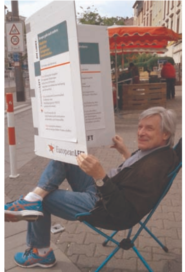
Zeitungsleser in Frankfurt. In Corona-Zeiten mit größerer Schrift und die Passant:innen lesen mit!

Aktionen für den Wahlkampf (nicht nur) in Coronazeiten.